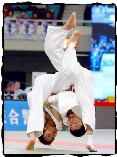
یکی از فنون زیبای جودو به نام uchi_mata

چند سال پس از مرگ وی سال ۱۹۵۲ فدراسیون بین المللی جودو تأسیس شد و «ریسی کانو» فرزند کانو فقید به ریاست آن برگزیده شد. ورود جودو در بازی های المپیک سال ۱۹۶۴ و در المپیک توکیو رقم خورد و مردم جهان شاهد اولین دوره مسابقات المپیک جودو شدند و امروز این ورزش در محیطی به وسعت جهان در حال پیشرفت و تعالی است.